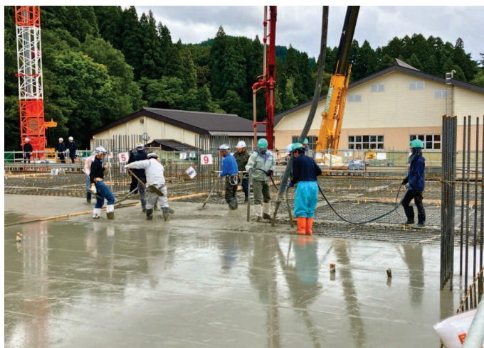
合 床の打設状況。コンクリートを打った所から 平らに均していきます