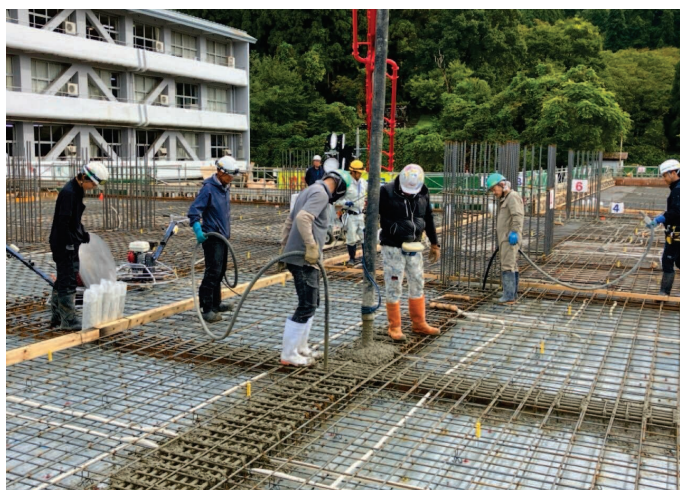
合 梁の打設状況。バイブレーターを使用し 気泡を追いつながら打ちます