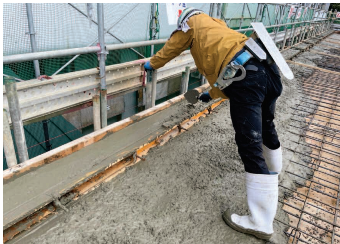
合 左官工事の様子。天端高さを確認しながら 生コンの量を調整しています